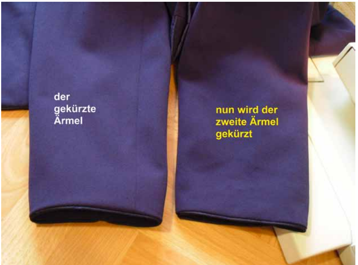
der gekürzte Ärmel