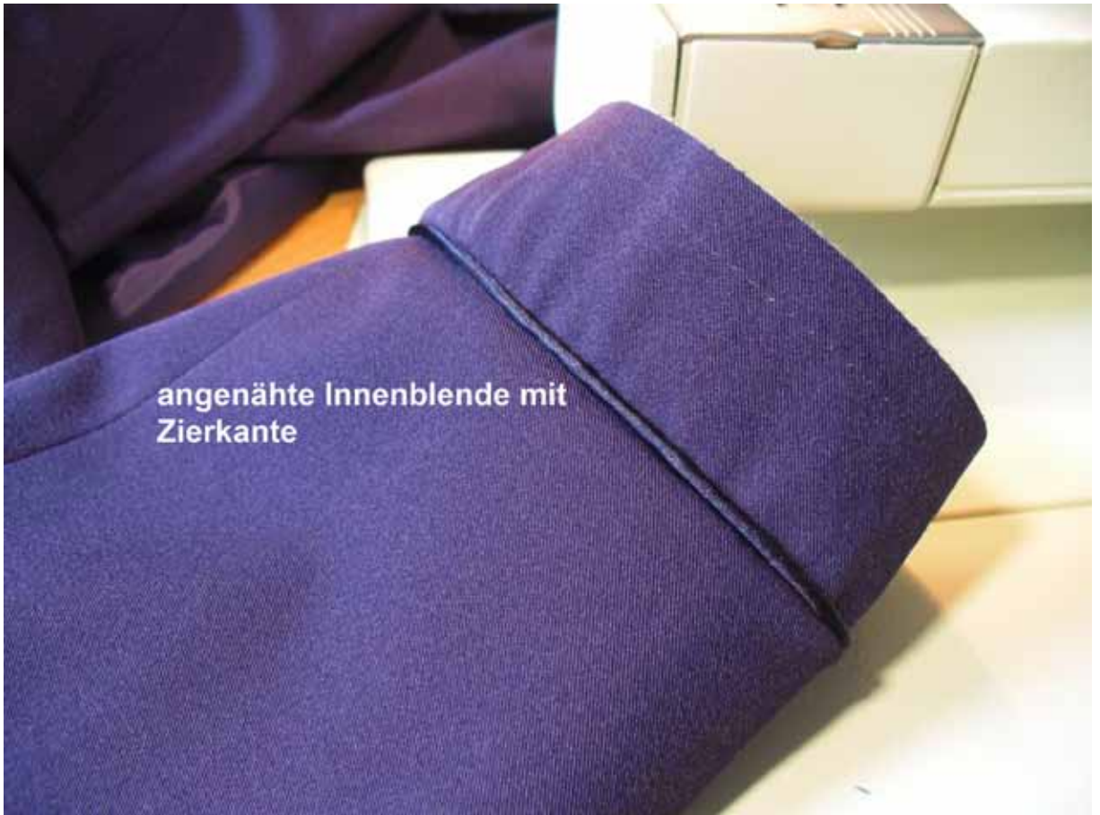
angenähte Innenblende mit Zierkante