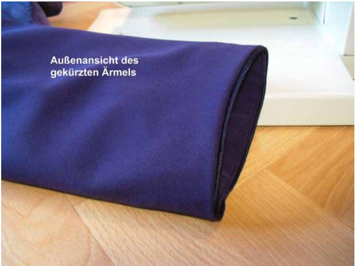
Außenansicht des gekürzten Ärmels